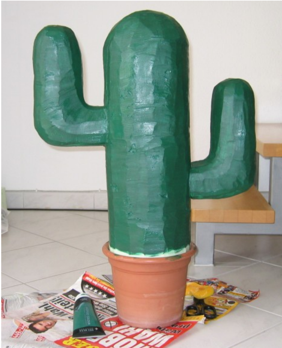
Löcher bohren und Holzdübel mit Heisskleber befestigen