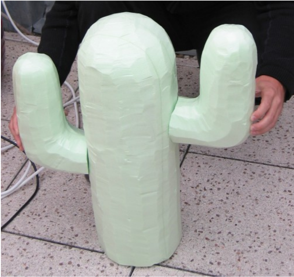
Kaktus mit erster Farb-Schicht, am schönsten nach 3 Schichten