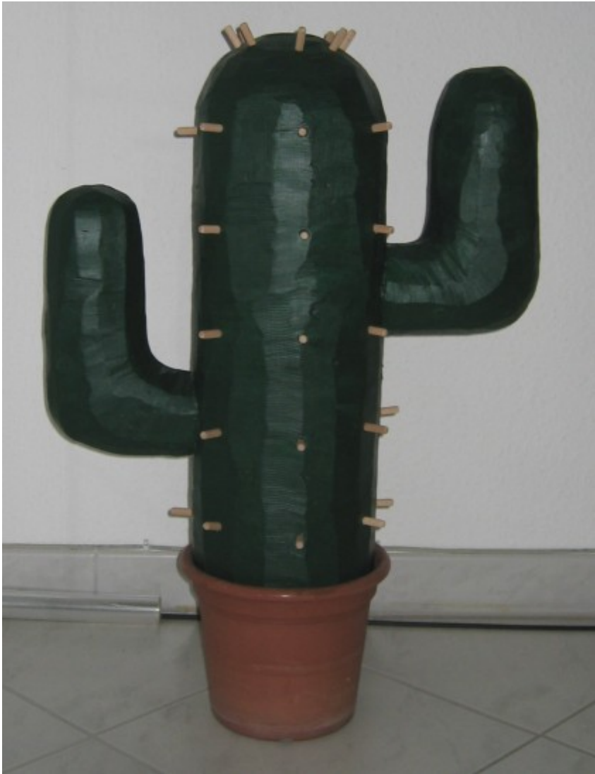
Geldscheine rollen und mit Gummibändern um die Dübel befestigen